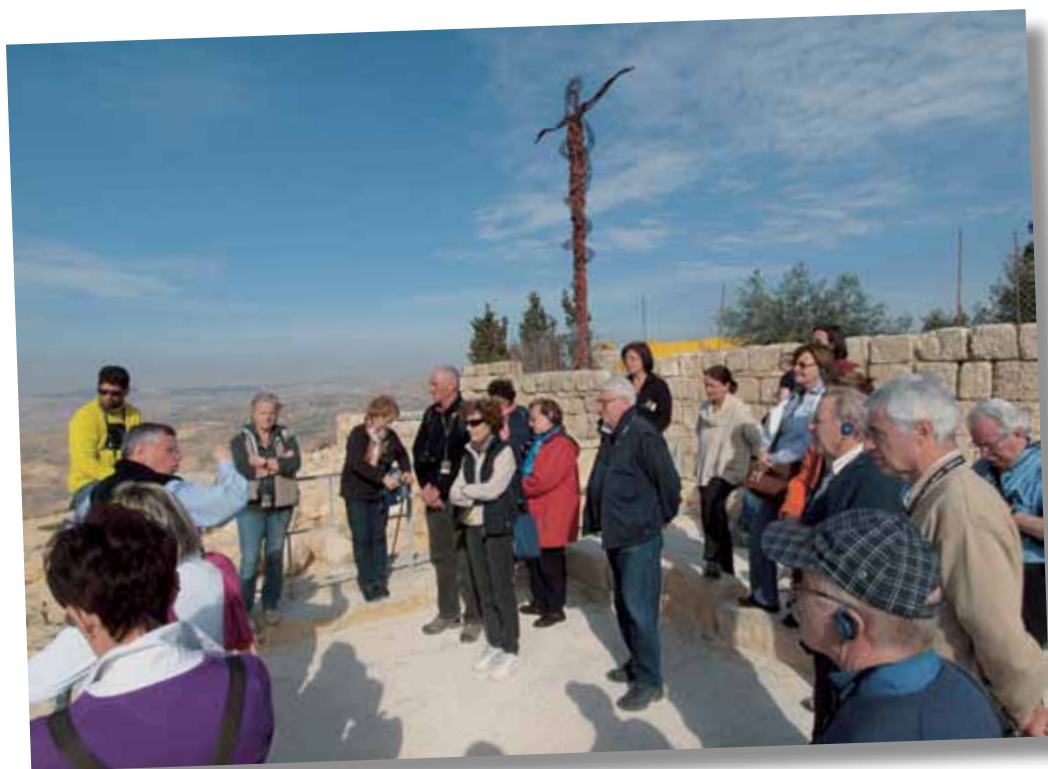
Sul Monte Nebo (serpente di bronzo), di fronte alla Terra Promessa.