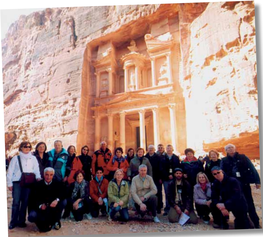
Davanti al monastero Al-Deir nella favolosa Petra.