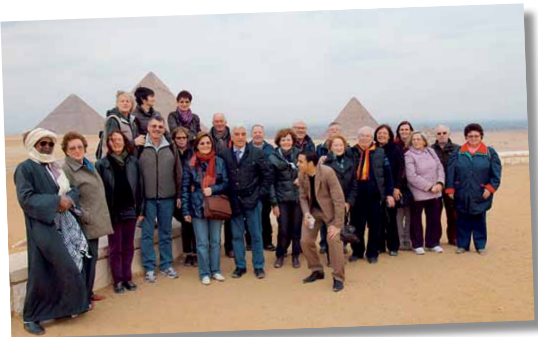
Davanti alle spettacolari Piramidi d'Egitto.

Al Sinai, nel "politicamente caldo" Egitto, spesso controllati dai militari, abbiamo dovuto seguire una rotta ben precisa e non abbandonare la strada. Troppo pericoloso. Nel deserto della Giordania, dove la situazione è pacifica, per forza seguire le indicazioni dei beduini con le jeep, altrimenti avremmo perso la strada e, probabilmente, non ne saremmo usciti tanto indenni. In questa Quaresima, con Gesù, è bene inoltrarci nel deserto per quaranta giorni, per verificare la rotta della nostra vita e riprogrammare il cammino dietro a Lui. Sapendo che solo seguendo il Signore, via, verità e vita, giunge-