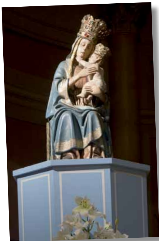
L'effigie della Madonna del Sasso a Mendrisio.

serio per tantissime persone in Ticino. Un riconoscimento alla missione e al ruolo della Chiesa ticinese nella nostra società.