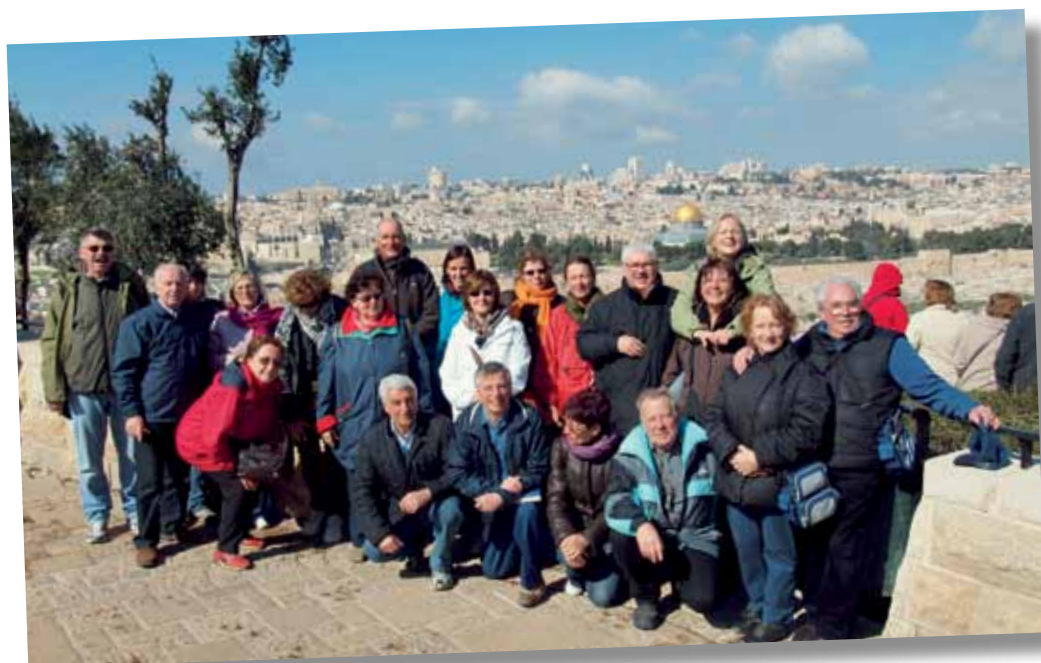
Davanti alla città santa di Gerusalemme.