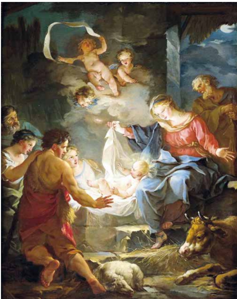
«Natività», collezione privata, Jean-Baptiste Marie Pierre (1714 -1789)