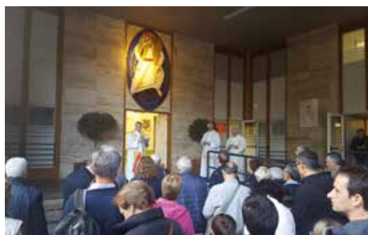
La Porta santa della Caritas, accanto alla stazione.