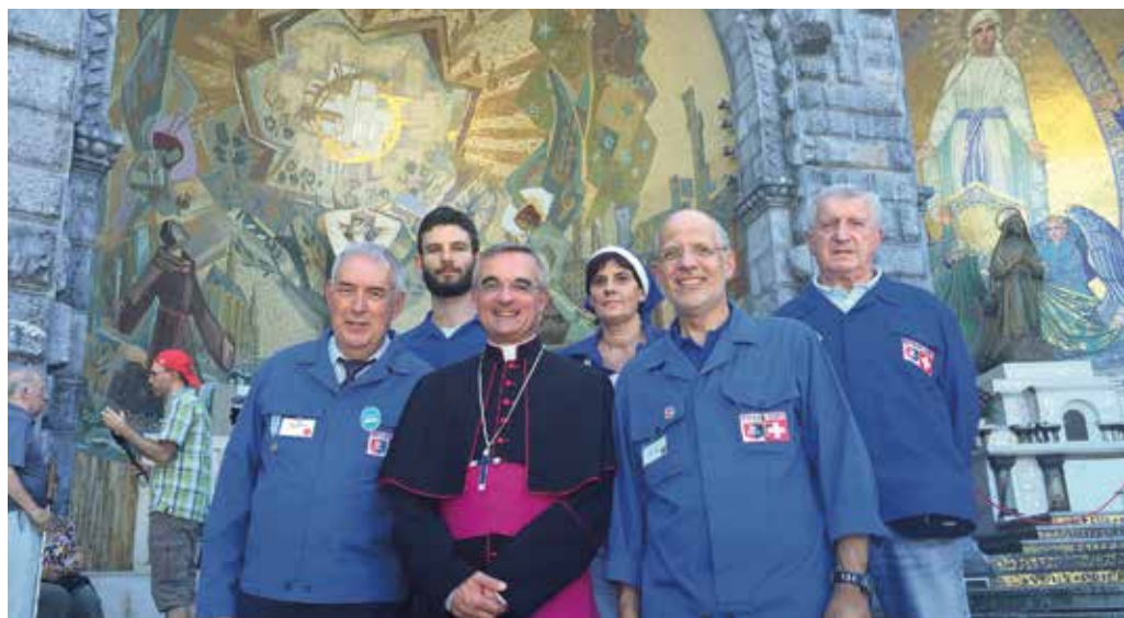
Il gruppo dei volontari balernitani.